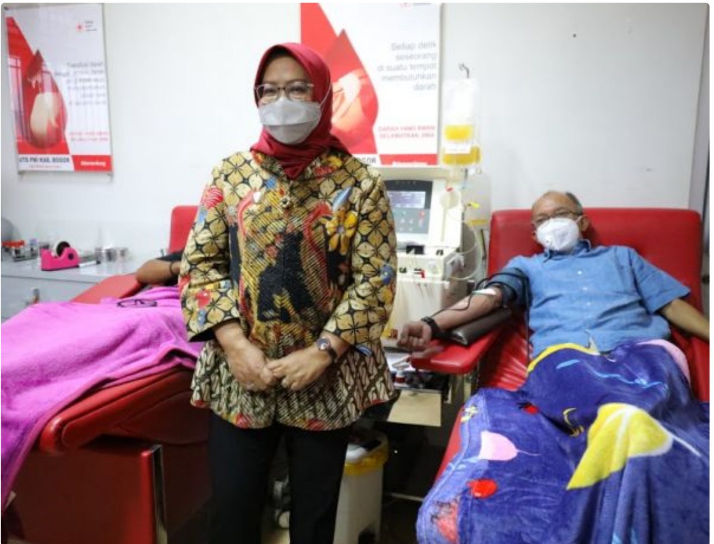
Ade Yasin cek proses donor plasma konvalesen di PMI Kabupaten Bogor.

BOGOR,- Bupati Bogor Ade Yasin ajak penyintas Covid-19 donorkan plasma konvalesen demi mengurangi penyebaran Covid-19 di Kabupaten Bogor. Menurutnya, pemerintah telah mencanangkan gerakan nasional donor plasma konvalesen. Hal tersebut diungkapkannya saat mengecek proses donor plasma