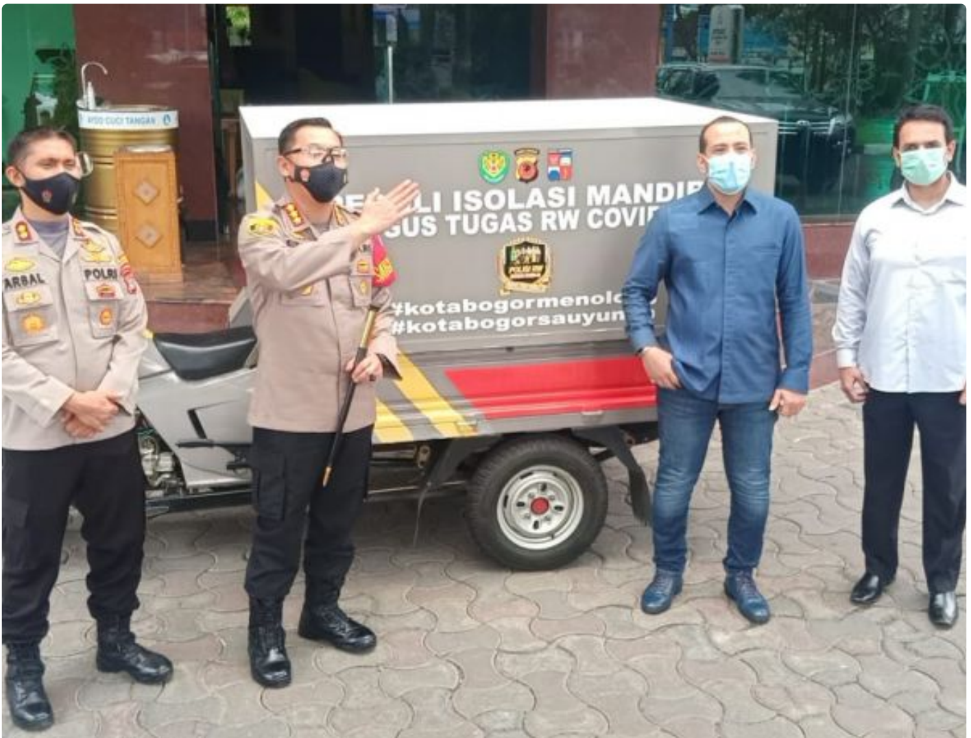
Kapolresta Bogor Kota bersama Wakapolresta jemput langsung bantuan Sembako bagi warga Isolasi Mandiri.