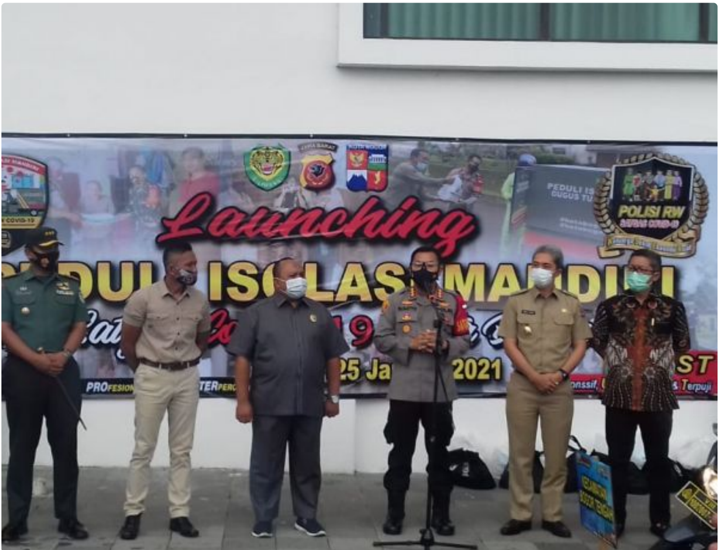
Launching Program Peduli Isolasi Mandiri Covid 19.

BOGOR,- Pandemi wabah virus Covid-19 di wilayah Kota Bogor masih terus berlangsung bahkan notabene jumlah angka pasien semakin bertambah. Demi membantu serta mendukung program Pemkot Bogor dalam menekan angka penyebaran virus tersebut, Kapolresta Bogor Kota melakukan langkah strategis terhadap kebijakan Pemkot dengan meluncurkan Program Peduli Pasien Positif Covid-19