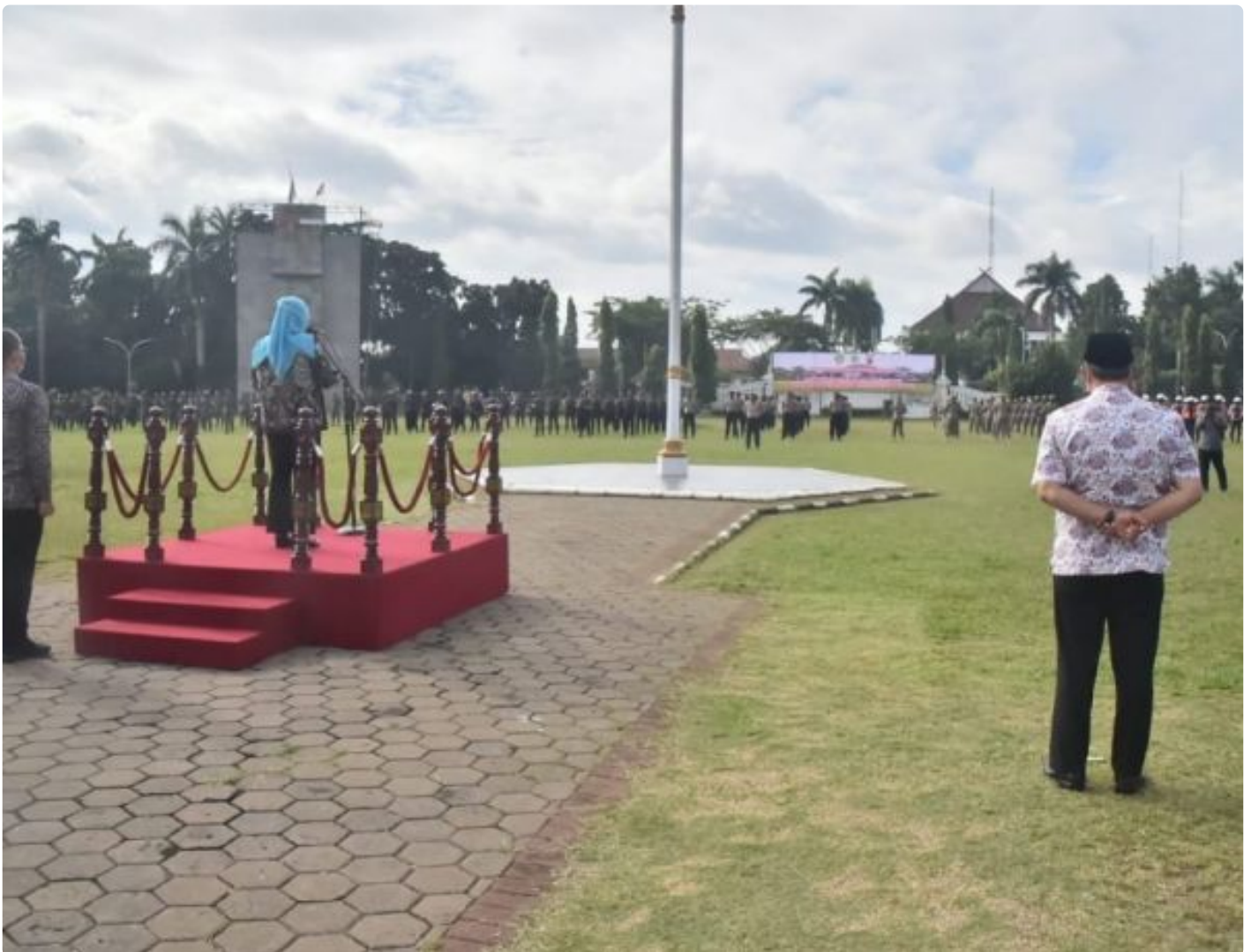
Bupati Bogor, Ade Yasin saat memimpin Apel pasukan persiapan Pilkades serentak tanggal 20 Desember 2020 di lapangan Tegar Beriman.

BOGOR,- Jelang Pelaksanaan Pemilihan Kepala Desa (Pilkades) serentak di Kabupaten Bogor yang akan berlangsung pada tanggal 20 Desember 2020 mendatang, Bupati Bogor, Ade Yasin memimpin Apel Kesiapsiagaan Pilkades Serentak di Kabupaten Bogor tahun 2020, bertempat di Lapangan Tegar